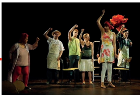
La rencontre « Tous au Théâtre ! »

Depuis 2014, nous invitons des établissements de la région à présenter une production théâtrale au théâtre de la Commanderie.