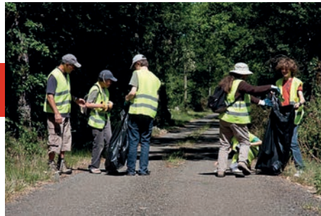
Notre participation à des actions citoyennes