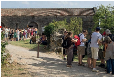
Sorties au festival de l'Été de Vaour