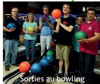
Sorties au bowling